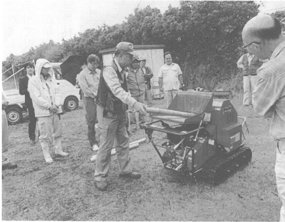
粉碎作業の実演、初心者でも簡単

カリー山形県山形市鑄物町46-1の樹木粉碎機は、樹木だけでなく、竹林の整備にも活用されている。竹を粉状にまで粉砕できるので、伐採した竹を処分する手間が省け、竹粉は土壤改良剤や堆肥としても活用が可能だ。今回、神奈川県の森林づくり活動に取り組み「かながわトラストみどり財団」を取材した。