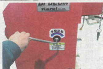
噛み込み解除機能を装備

式＝4枚刃送りローラー自動間欠式▽調速装置＝遠心クラッチ制御▽排出方式＝空気搬送(フロアシューター)▽ダクト高さ＝1197mm▽排出方向＝全方位回転▽付属品＝ドライブシャフトまたはφ35スプラインアダプタ、解除レンチ、保護メガネ、刃物スキマゲージ、他 希望小売価格(税抜)はPTO-1200Nが81万2千円、同1200Hが87万8千円。 同社ホームページ「粉砕機ドットコム」http://fmsai.ki.com/ではPTOシリーズをはじめ同社製品の実演動画を好評配信中。また樹木粉砕機の無料実演も受け付けている。問い合わせはフリーダイヤル0120-933-090まで。