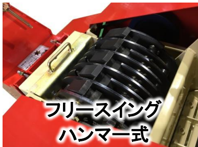
フリースイング ハンマー式