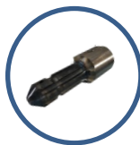
スプラインアダプター 標準付属