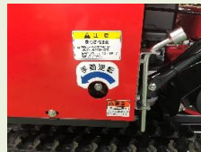
▲手動逆転軸と解除レンチ