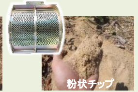
●オプション細目スクリーン